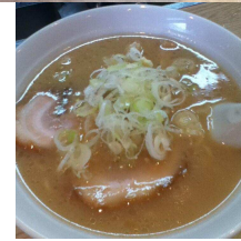
↑キリンのタオルやビールチョコなどがあるお土産屋 ↑昼食は急遽決まった「信長ラーメン」。赤からラーメン950円&ラーメン700円 ←戦国アイドルユニットに遭遇した清洲城(左)と、由緒抜群の熱田神宮・本殿(右)