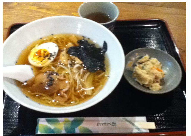
↑隣の醤油蔵を改装した店舗で食べたしょうゆラーメン500円。